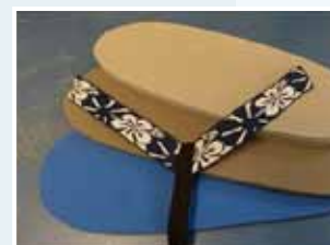
Materialauswahl mit Bettungsrohling Triplex N