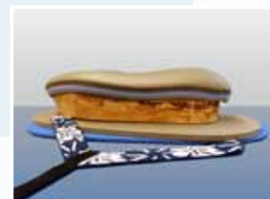
Bausatz Triplex N angeformt